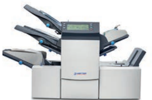
Vkladač dokumentů SI 3350