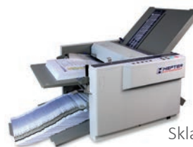
Skládačka TF MEGA-A